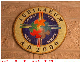
Simbolo Giubileo 2000